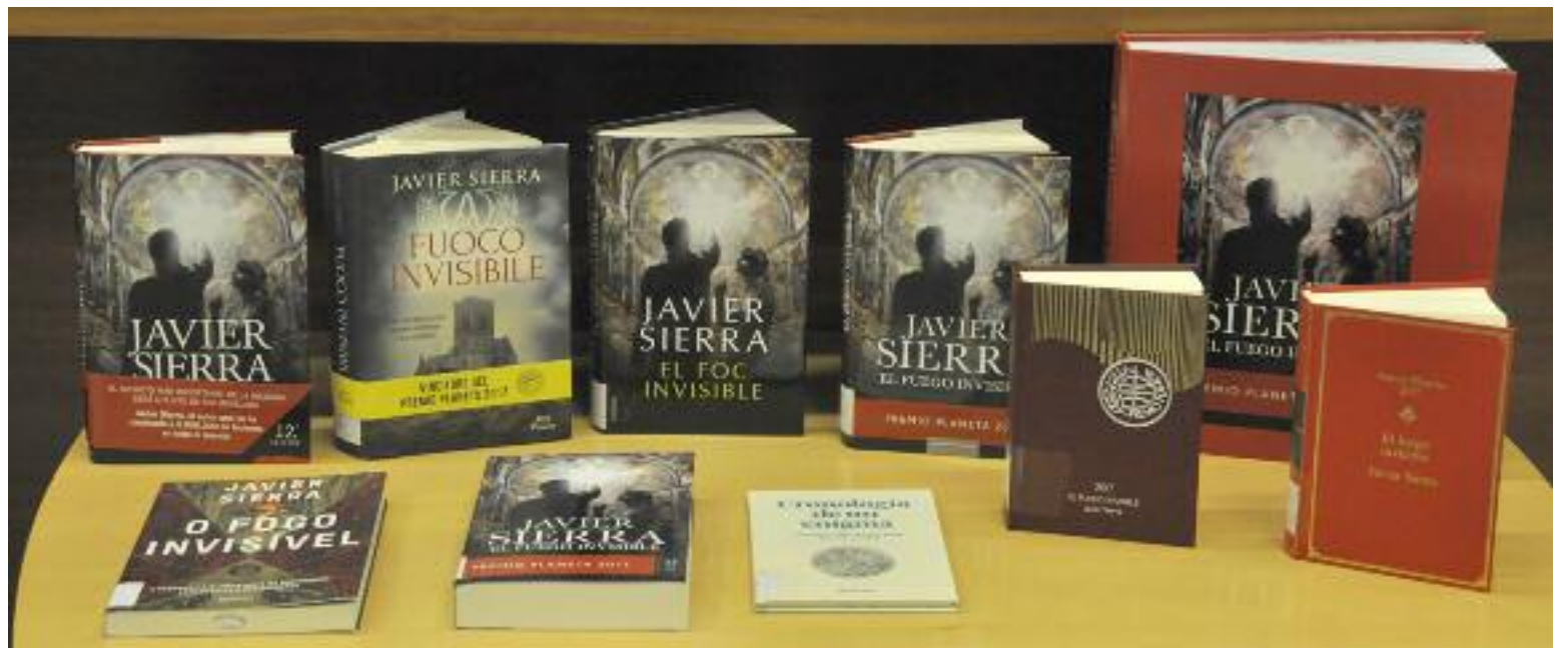
Algunas de las traducciones del Premio Planeta 2017, 'El fuego invisible', que están depositadas en el Legado Javier Sierra de la Biblioteca de Teruel. M. A.

ra edición de Plaza & Janés de La cena secreta (2004), la obra que le catapultó a la fama mundial.