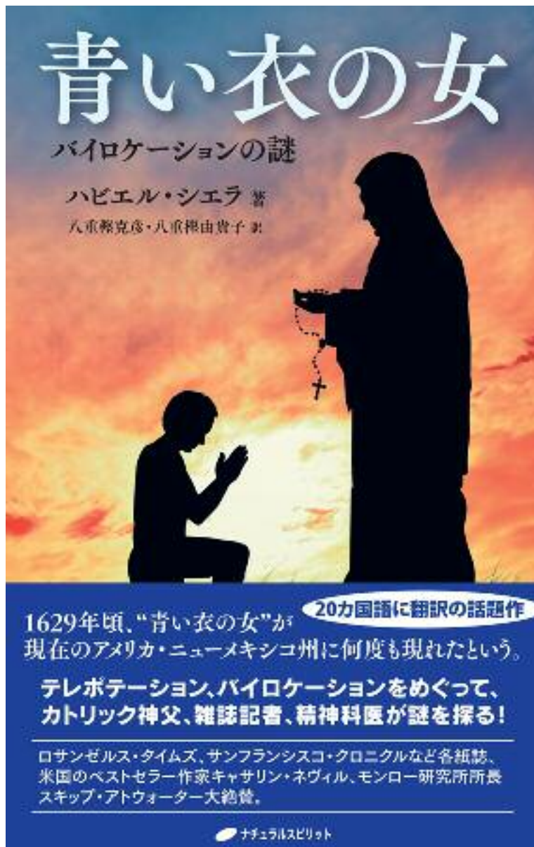
'La Dama Azul' ha sido recientemente traducida al japonés