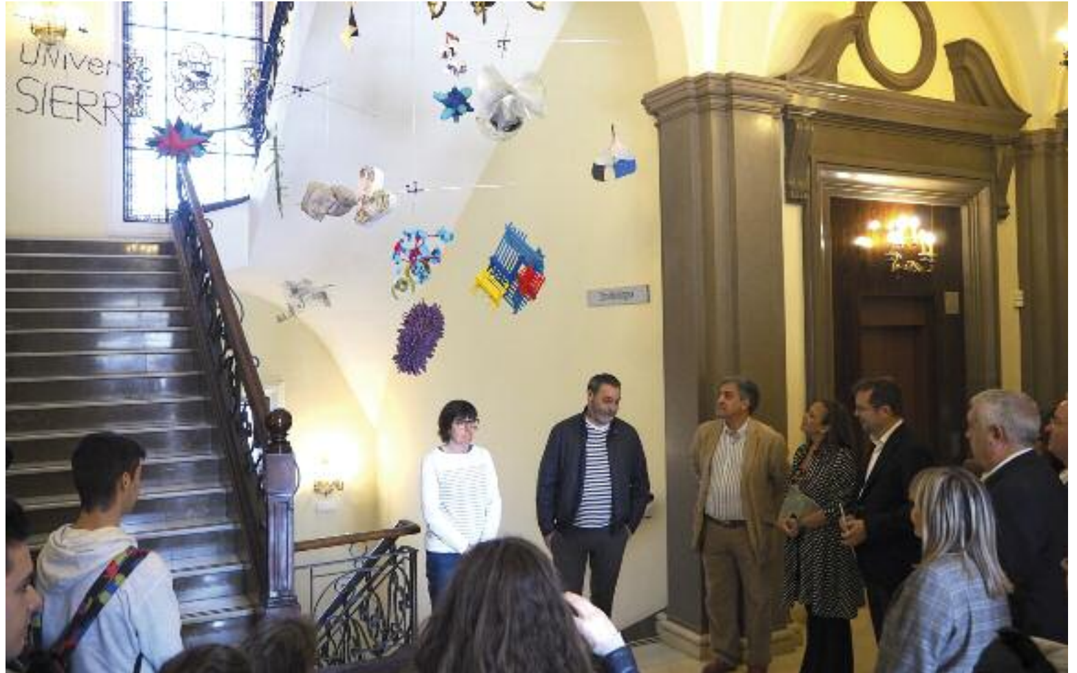
El profesorado de la Escuela de Artes de Teruel, explica al escritor turolense la obra 'Universo Sierra' creada por los estudiantes de Volumen.